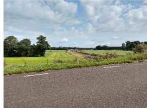
Dit is de locatie Borculoseweg ter hoogte van de N18. Ruimte lijkt er voldoende te zijn.